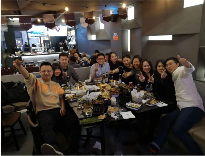
亲如一家的MCFO同学们

同时,小班制的MCFO项目也为班内同学充分认识和交流提供了机会,形成了温暖的集体氛围。在课堂上,大家踊跃参与讨论,就经济财务问题各抒己见;在课下,大家积极参加团建活动,在欢声笑语中形成归属感。