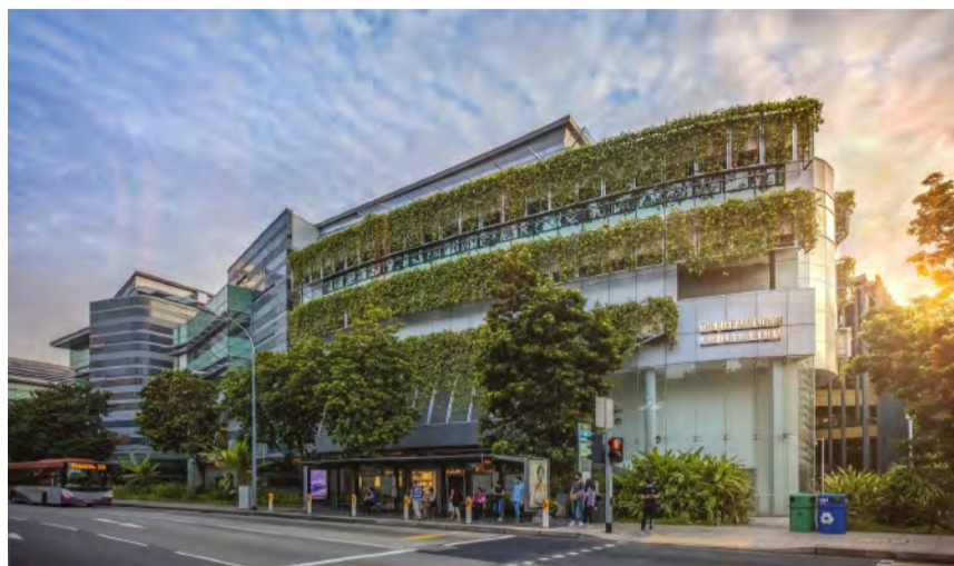
新加坡管理大学会计学院

今年是新加坡管理大学会计学院 (SMU SOA) 成立20周年, 会计学院专门出版了一本成就集锦并推出Pang Yang Hoong奖学金以此庆祝。与此同时, 在2021年10月8日(周五)举办了2021年首届金融市场数字化转型会议, 有超过300名会计和金融领域的行业从业者、商业业主和监管机构参加了本次线上会议。