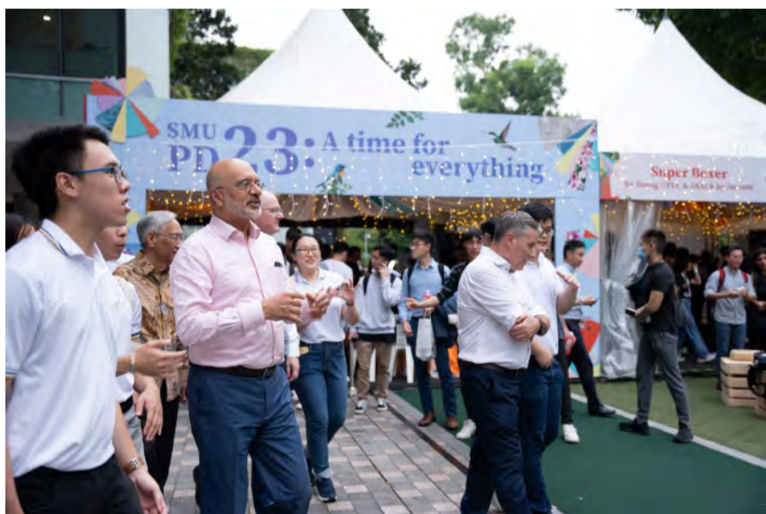
新大董事会主席Piyush Gupta先生(身穿粉红色衬衫)参观艺术节场地

新大赞助者Halimah Yacob总统和新大董事会新任主席Piyush Gupta先生出席了此次活动。在组委会成员、董事会成员和高级管理层的陪同下,一起参观了节日场地,并与学生进行互动。