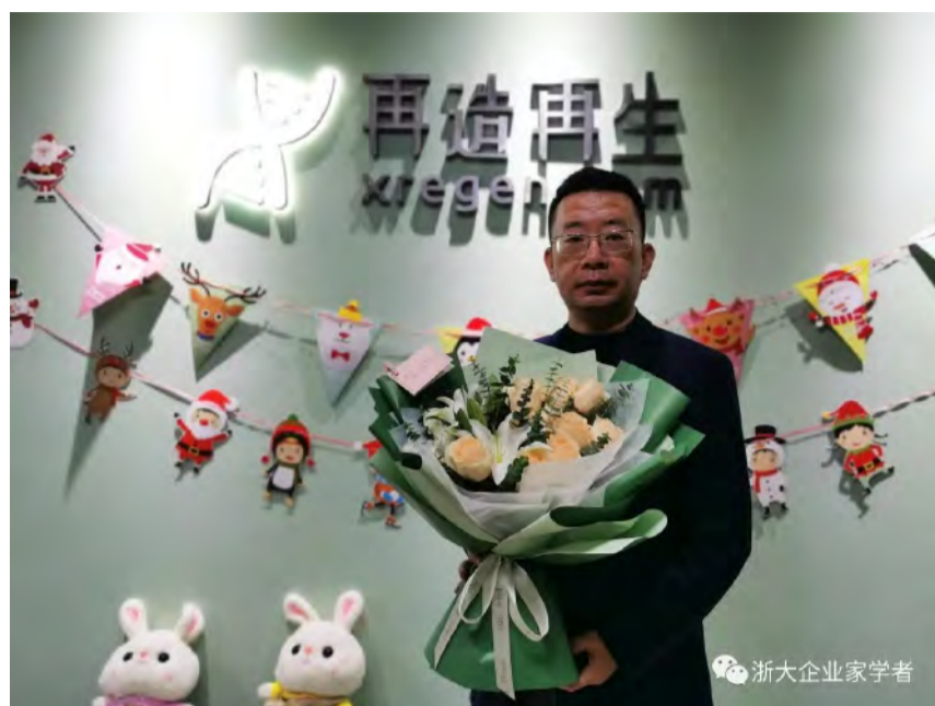
全班同学赠送的鲜花

3、对中小微企业而言，在谋求提升创新绩效的过程中，如何从供应链的角度去评定、选择适合自身的服务型制造平台，弥补发展过程中的资源不足问题提供帮助。