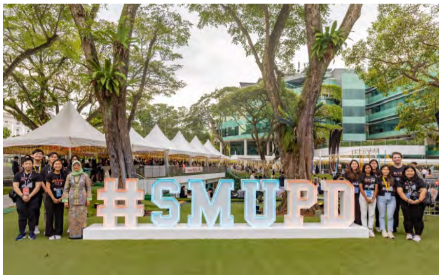
新大赞助者、Halimah Yacob总统与SMU PD 2023学生组织委员会成员在校园绿地合影留念

2023年1月13日(星期五),新加坡管理大学(SMU)以“万物之时”为主题,在校庆日(PD)庆祝成立23周年。在经历了两年的混合式校庆之后,新大社区终于迎来了热闹的现场庆祝活动,大家齐聚在校园绿地上纪念这一特殊时刻。