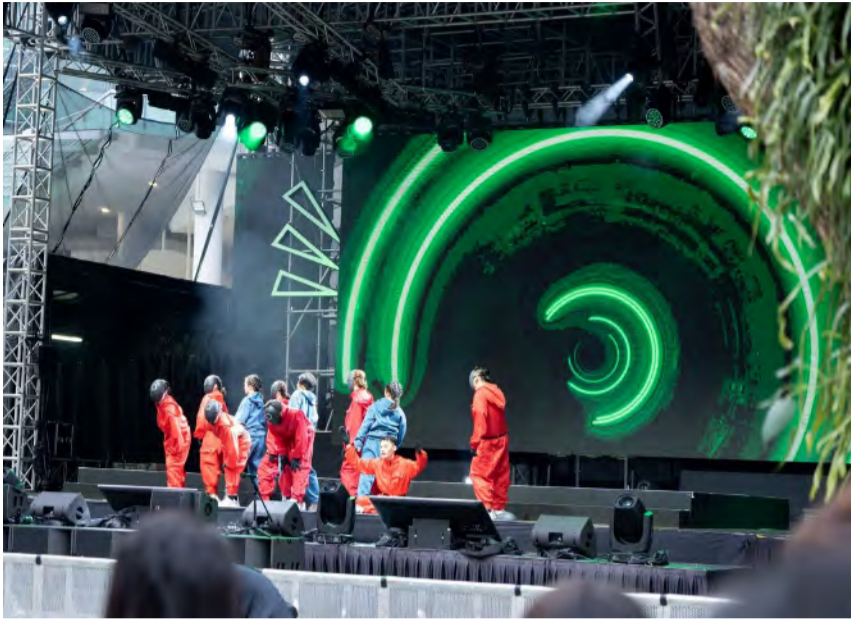
SMU Funk Movement 以他们流畅的舞蹈动作吸引了许多观众