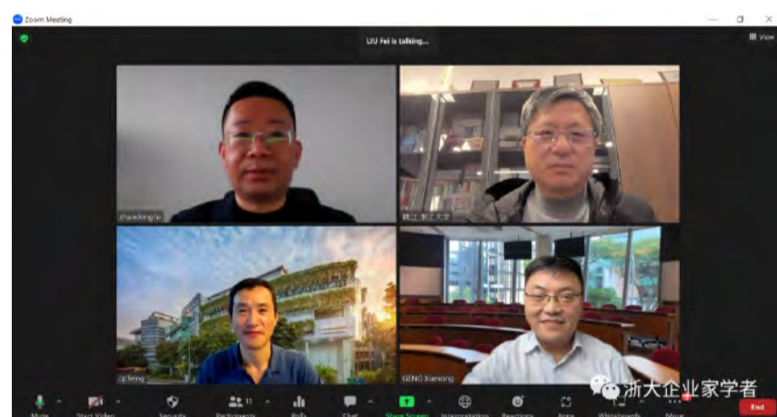
论文通过后与论文导师团队大合影