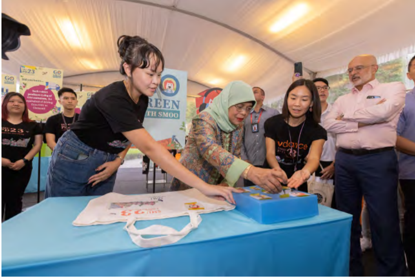
Halimah总统选择PD 2023独家logo装饰手提袋， 以支持升级回收倡议与SMOO绿色行动