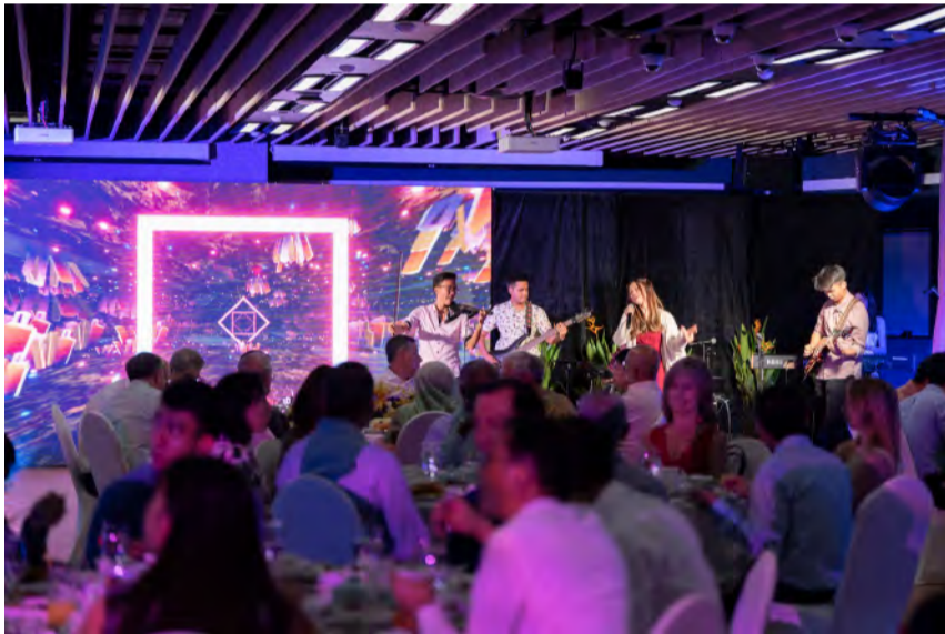
新大音乐社团SoundFoundry在晚宴上为来宾表演

江教授还强调了新大在国际化、行业参与和创新以及创业方面的发展。展望未来,实施可持续发展蓝图和促进数字化转型将继续是新大的战略重点。这些项目包括与校园餐饮租户合作,以更好地管理食物浪费,以及更新我们的企业资源计划(ERP)系统,以提高生产力和用户体验。