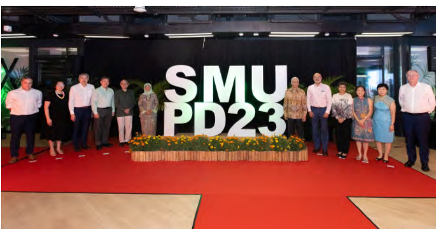
新大董事会、高管人员、新大赞助人以及Halimah Yacob总统合影

与此同时,我们的贵宾们在新大的Connexion享用了晚宴,并与董事会、新大高管人员和教职员工进行了互动。